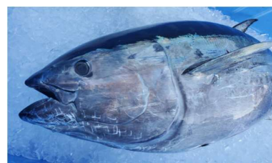
近大生まれマグロ